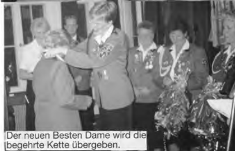
Der neuen Besten Dame wird die begehrte Kette übergeben.