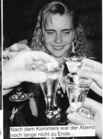
Nach dem Kommerz war der Abend noch lange nicht zu Ende...