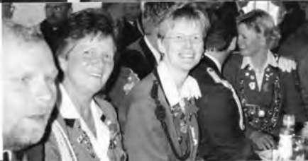
Schon wieder gute Laune beim Königsfrühstück (links u. unten)