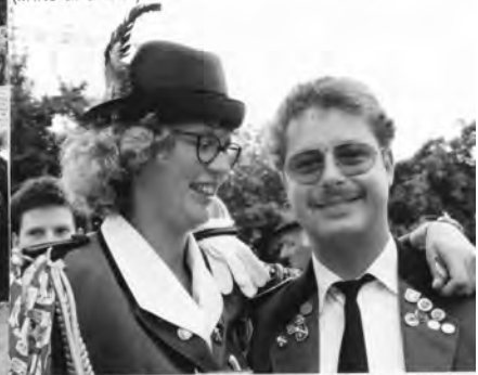
König Gerhard beobachtet das Geschehen (links)