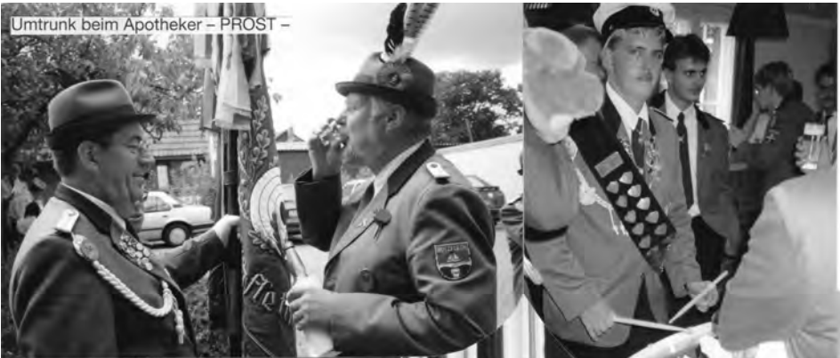
Umtrunk beim Apotheker – PROST –